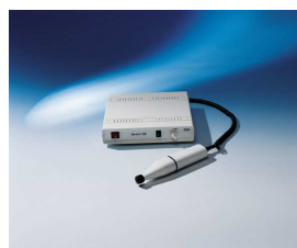
BMS „UNOST“ SF