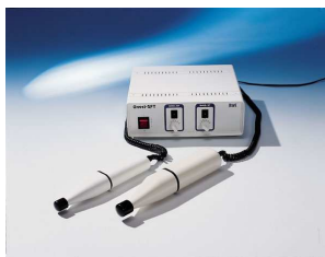
BMS „UNOST“ SFT