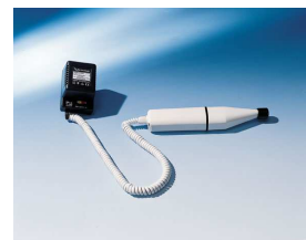
BMS „Bio Handy“